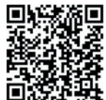
Google Play Store (Android)

Laden Sie nun die VR-SecureGo-App herunter.