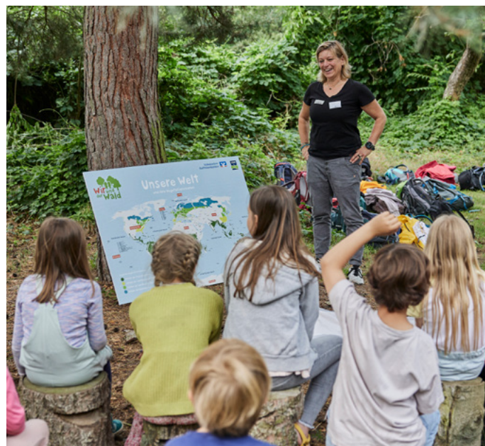
Ökologische Bildung zum Anfassen bei „Wir und der Wald“

2025 geht es bereits ins dritte Jahr der Klima-Initiative „Morgen kann kommen“. Das nächste Ziel: Die Baumpflanzaktion „Wurzeln“ soll weiterwachsen und so zur größten unternehmerischen Baumpflanzaktion in Deutschland werden. Mit vereinten Kräften werden die Volksbanken und Raiffeisenbanken auch im kommenden Jahr Setzlinge in ihrer Region finanzieren. Die Ausweitung der Aktion erhöht aber auch den Finanzierungsbedarf. Um die Aktion so groß wie nur möglich werden zu lassen, wird es ab voraussichtlich März 2025 über einen Webshop auch für Einzelpersonen möglich sein, Setzlinge zu stiften. So wird aktiver Klimaschutz mit den Volksbanken und Raiffeisenbanken so leicht und auch so breit ausgerichtet wie noch nie.